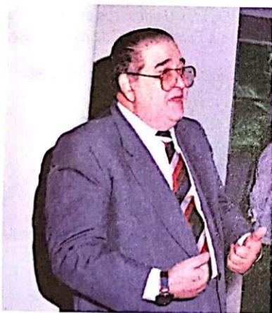
La administración de Guillermo Endara Galimany (en la imagen) permitió la influencia de Estados Unidos en muchos aspectos del gobierno; por ejemplo, en la supervisión de los ministerios del país y en el asesoramiento para la nueva Fuerza Pública.

Producto Interno Bruto. Valor total de los bienes que se producen y los servicios que se brindan en un país.