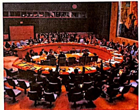
El Consejo de Seguridad de la ONU tiene como objetivo evitar, por la vía diplomática, el enfrentamiento armado entre los países miembros. (En la imagen, una sesión del Consejo de Seguridad de la ONU).